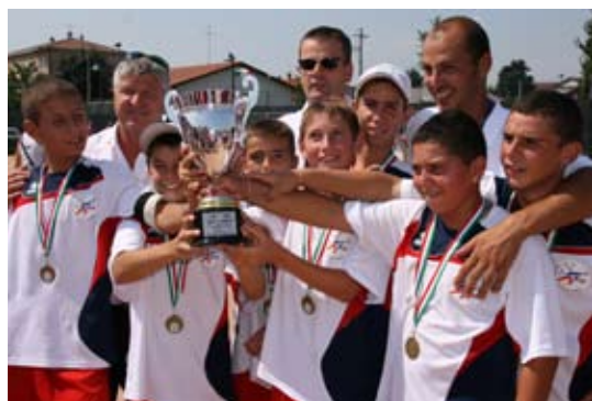
Victoire 2009 Catégorie moins de 14ans

Progressivement, les jeunes et les femmes ont été intégrés à ces rencontres. Depuis 2005, huit catégories regroupant les meilleurs joueurs nationaux s'affrontent : Sénior A Masculin, Sénior A Féminin, Sénior A' Masculin, Sénior A' Féminin, Junior Masculin (moins de 18 ans), Junior Féminin (moins de 18 ans), Cadet (moins de 16 ans) et une catégorie moins de 14 ans.