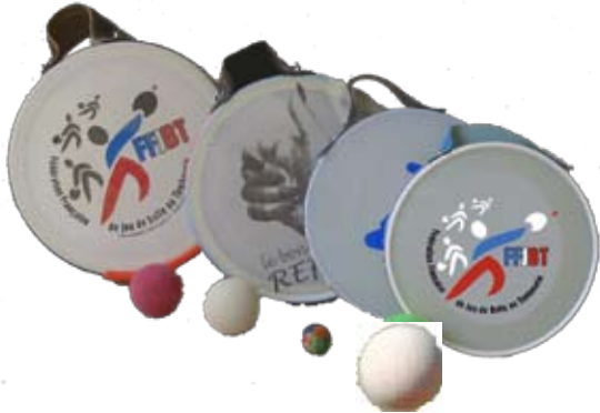
Gamme de Tambourins

La balle est en caoutchouc dur, d'un diamètre de 65mm et d'un poids de 59g. Elle est de couleur blanche ou rouge.