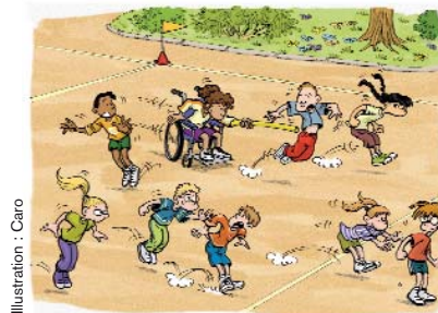
Illustration : Caro

À savoir : depuis 1960, les épreuves paralympiques sont organisées et depuis 1988, les jeux paralympiques se déroulent tous les 2 ans.