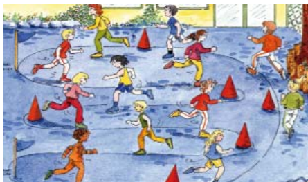
Illustration : V. Suetrac

allure adaptée et régulière ; établir sa performance.