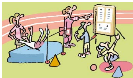
Illustration : R. Cannella

À savoir : lors de la cérémonie d'ouverture, un juge-arbitre prononce, au nom de tous, le serment olympique.